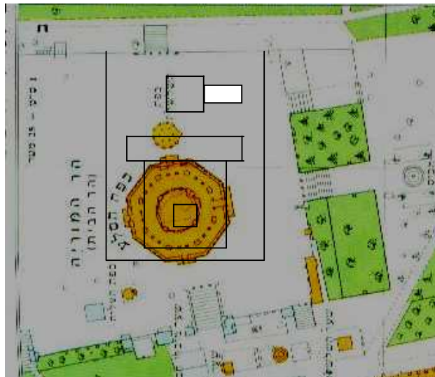
המזבח נמצא חמישה עשר מטר מזרחית דרומית לכפת הסלע

מהתרשים עולה ששער ניקנור נמצא קצת מדרום למדרגות הקיימות היום, פתח האולם נמצא מדרום מזרח לכפת השלשלת (כלומר: כפת השלשלת נמצאת כמעט כולה בתוך האולם), פתח ההיכל נמצא בקצה המערבי של כפת השלשלת. המזבח נמצא ממזרח לכפת השלשלת. לפי התרשים, אפשר לעלות לרמה מדרום, ממערב, ובעקר מצפון. במערב אפשר להכנס אל תוך המבנה המתומן. באחת העליות להר הבית, הראה לי אחד האנשים, שעל הרמה אפשר להבחין בבירור בקו של קפל קרקע שהולך ממזרח למערב, מצפון לכפת הסלע. אפשר שהוא חומת העזרה. כמובן שלא עליתי לרמה לבדוק, ואינני יכול לומר מה המרחק המדויק בינו לבין הסלע. הנתונים אינם משתנים בהרבה גם אם נקח, לדוגמא, אמה של 56 ס"מ: