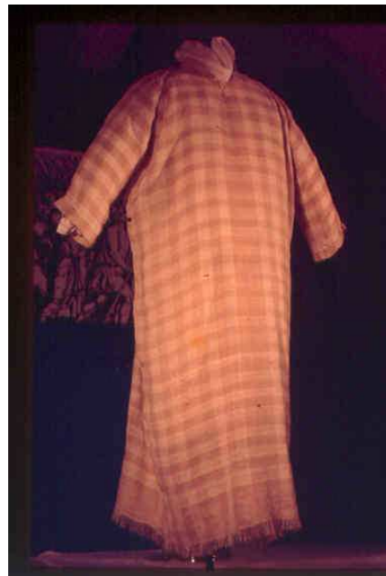
כתונת תשבץ עשויה פשתן 'שש משזר'.